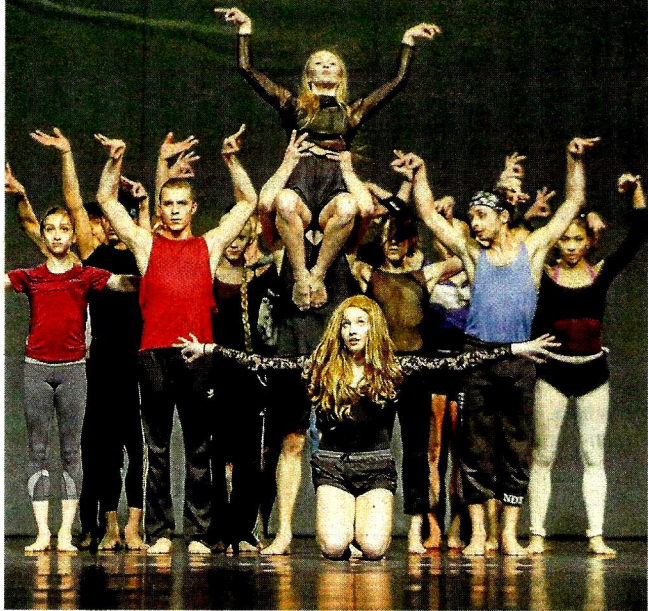
Das Ensemble bei der Probe.